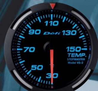
TEMP. 温度計 ●DF06704 15,750円(工賃別) 15,000円(本体価格)