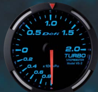
TURBO ターボ計 ●DF06504 19,950円(工賃別) 19,000円(本体価格)