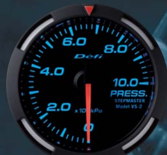
PRESS. 圧力計 ●DF06604 23,100円(工賃別) 22,000円(本体価格)