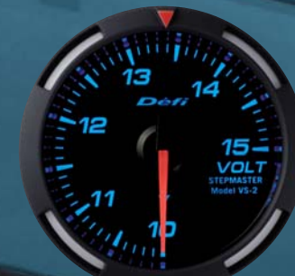
VOLT 電圧計 ●DF07004 12,600円(工賃別) 12,000円(本体価格)