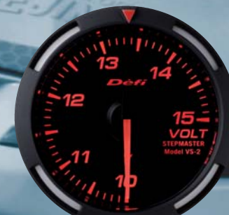
VOLT 電圧計 ●DF07005 12,600円(工賃別) 12,000円(本体価格)