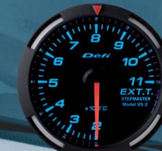
EXT.T. 排気温度計 ●DF06804 23,100円(工賃別) 22,000円(本体価格)