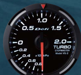
TURBO ターボ計 ●DF06506 19,950円(工賃別) 19,000円(本体価格)