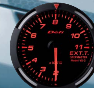
EXT.T. 排気温度計 ●DF06805 23,100円(工賃別) 22,000円(本体価格)