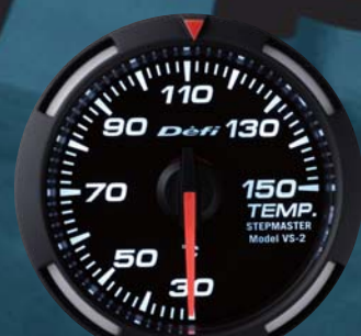
TEMP. 温度計 ●DF06706 15,750円(工賃別) 15,000円(本体価格)