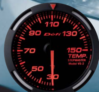
TEMP. 温度計 ●DF06705 15,750円(工賃別) 15,000円(本体価格)