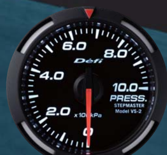
PRESS. 圧力計 ●DF06606 23,100円(工賃別) 22,000円(本体価格)