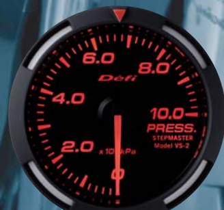
PRESS. 圧力計 ●DF06605 23,100円(工賃別) 22,000円(本体価格)