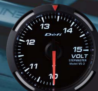
VOLT 電圧計 ●DF07006 12,600円(工賃別) 12,000円(本体価格)