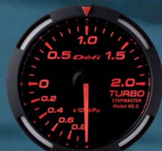
TURBO ターボ計 ●DF06505 19,950円(工賃別) 19,000円(本体価格)