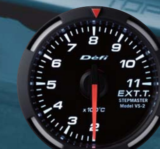
EXT.T. 排気温度計 ●DF06806 23,100円(工賃別) 22,000円(本体価格)