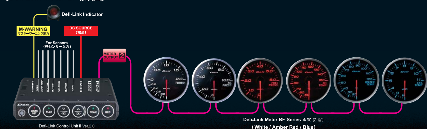
Defi-Link Meter BF Series φ60 (2 3/8") (White / Amber Red / Blue)

※油圧・燃圧・油温・水温のセンサーの取り付けには、ネジサイズ1/8PTの市販センサーアタッチメントが別途必要となります。 ※ご使用の際には、別途別売のDefi-Link Control Unit IIをご用意ください。 ※12V車専用です。24V車には取り付けられません。